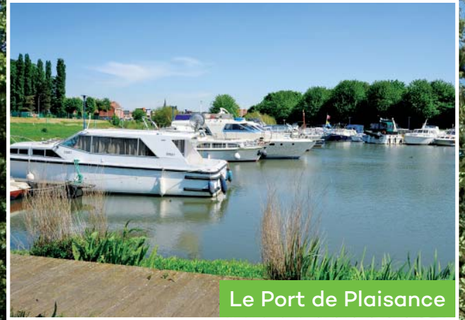
Le Port de Plaisance