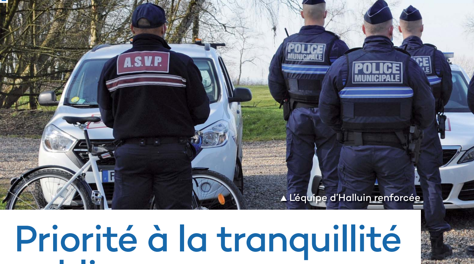
▲ L'équipe d'Halluin renforcée