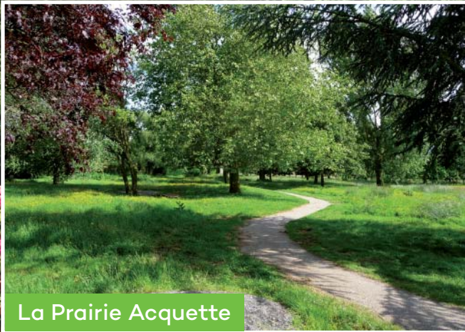
La Prairie Acquette