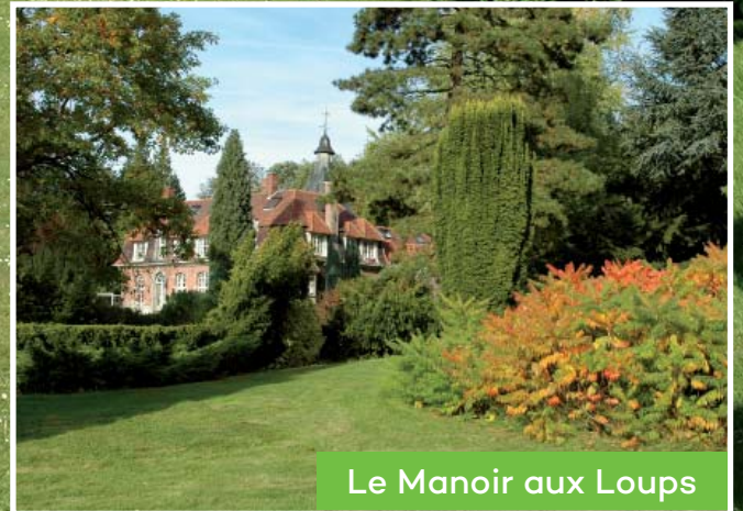
Le Manoir aux Loups