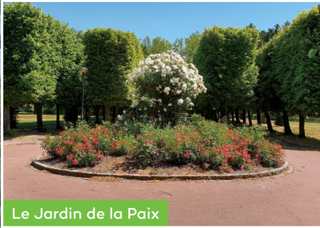
Le Jardin de la Paix